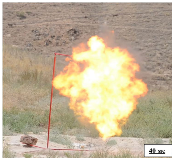
Рис.1. Фотография взрыва заряда ТЭНа массой 20 гр.

На рисунке видно, что в момент времени t 40 мс происходит выброс диспергированного горящего пиротехнического заряда в атмосферу, причем скорость разлета, диаметр наблюдаемого объекта (6-8 м) и интенсивность джетов